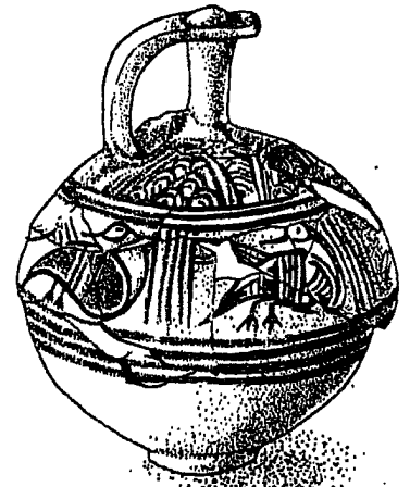
כלי חרס פלשתי מעטרת

מלבד השופטים המושיעים הגדולים לים נזכרו בספר שופטים גם "שופטים קטנים" (שופ' י 1-5; יב 7-15). הללו שפטו את העם ממקום מושבם. לעיתים מודגש בכתוב עושרם המופלג. אין בידינו מסורות על מלחמות בהנהיגתם. נראה שבברית (ואפשר שהיו שתי בריתות פאלה) היתה משרח קבועה של שופט, שאולי עברך משבט לשבט לפי הסדר מסוים, וסמכויותיה היו מוגבלות למדי בימי שלום. מספר "השופטים הקטנים" שנמנו בספר הוא חמישה ויחד עם השופטים הגדולים מתקבל המספר 12, שופט לכל שבט. ספק אם אלה היו כל השופטים הקטנים, וייתכן ששמותיהם נבחרו לפי ייחוסם השבטי, פדי שלא לקפח את השבטים שלא זכו להוציא מתוכם שופט מושיע.