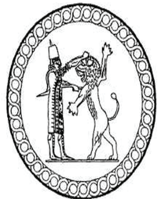
◀ טביעת חותם מלכותי: מלך אשור לוחם באריה

כאשר נחשפו ארמונות מלכי אשור בנינוה באמצע המאה ה-19, נתגלתה דמותו של המלך האשורי כשהוא נלחם באריות. בנוסף נמצאו כתובות בהן מכריזים על עצמם מלכי אשור שהם אריות: "אני אריה ואני גיבור" (אשורנצפל השני)