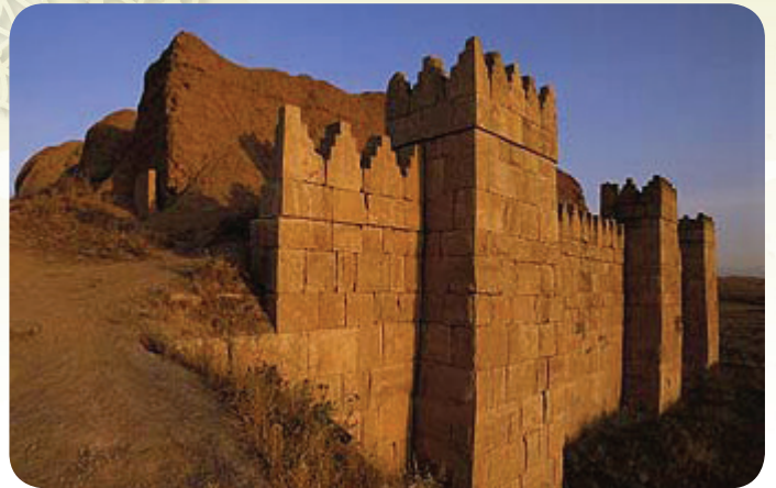
◀ תצלום של חומות העיר נינוה כיום