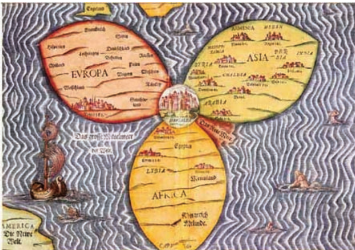
מפת בונטינג < ("מפת עלי התלתן") גרמניה 1585

רחבות ומענה לשאלות: מתן על הפרק "perek.matan@gmail.com" f